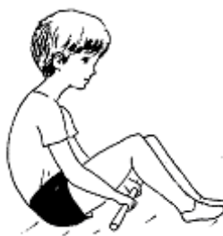
2. Перешагни сидя.