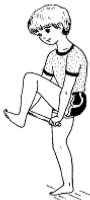
1. Перешагни через палку.

Лечь на спину, держать палку в вытянутых руках перед собой. Сильно сгибая ноги, стараться перенести их через палку и возвратиться в исходное положение.